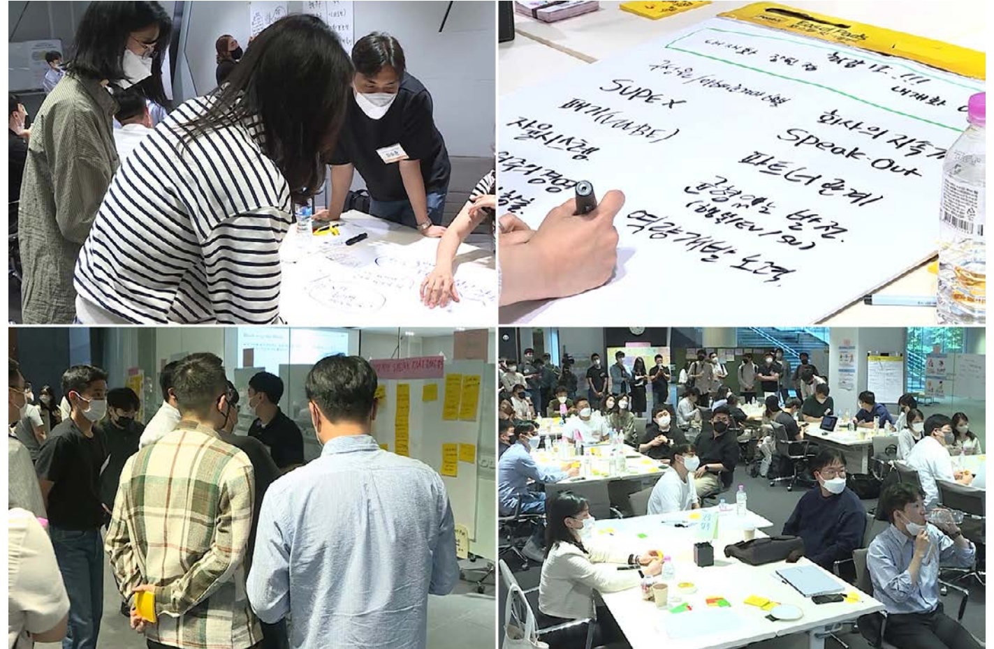
SK이노베이션 계열 구성원들의 소통을 위한 다양한 iCON 활동

SK이노베이션은 구성원의 원활한 소통과 협업 분위기 조성을 위해 다양한 온·오프라인 채널을 활용하여 소통 활동을 전개하고 있습니다. 특히, 리더와 구성원 간 소통의 가교 역할을 할 체인지 퍼실리테이터(Change Facilitator)로 285명의 ‘iCON(innovation Communication ON)’을 선발하여 구성원과 리더, 경영층의 양방향 소통을 강화하고 구성원 중심의 진정성 있는 소통을 실현하고 있습니다. 또한, 온라인 사내 게시판 ‘tongtong’을 통해 구성원들이 자유롭게 토론할 수 있도록 지원하는 등 소통 활성화를 도모하였으며, 모바일 앱 ‘공’을 도입하여 구성원 스스로 행복을 추구할 수 있도록 다양한 행복 콘텐츠를 제공하였습니다. 더불어 다양한 사업장과 직군의 구성원들과 만나 소통하는 프로그램 등 직접적이고 적극적인 소통의 창구를 만들어 보다 효과적인 소통과 협업을 통해 조직의 성과를 높이고자 하였습니다. 최근에는 사회적 거리두기가 해제되며 구성원 가족이 함께 참여할 수 있는 행복산책을 재개하여 가족에게 일상 속 Refresh 및 행복을 경험할 수 있는 기회를 제공하고 있습니다.