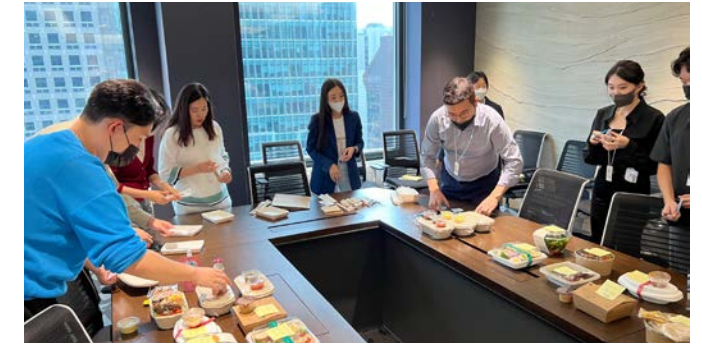
SK이노베이션 주요 사업장의 식사 질 개선을 위한 ‘미식 Clan’

SK이노베이션은 2020~2021년까지 Clan 형태 등의 행복 과제를 SK이노베이션 계열 공통으로 진행해왔으나 2022년부터는 구성원의 행복 공감 및 체감도를 더욱 높이기 위해 SK이노베이션 산하 사업 회사별 맞춤형 행복 과제를 진행하고 있습니다. 행복 서베이 분석 결과를 기반으로 사업 회사별 각각의 니즈에 맞는 자체 행복 과제를 총 29건 진행하였으며, 각 사업 회사에서 진행한 행복 과제에 대한 구성원의 인식 수준, 공감도 및 만족도를 확인할 수 있었습니다. 2023년에도 이 기초를 이어 각 사업 회사별로 최적의 행복 과제를 선정하여 실행할 예정입니다.